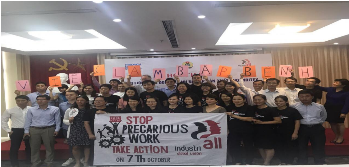
Participantes de la 2ª Conferencia de la Red Sindical de la Cadena de suministro de Inditex