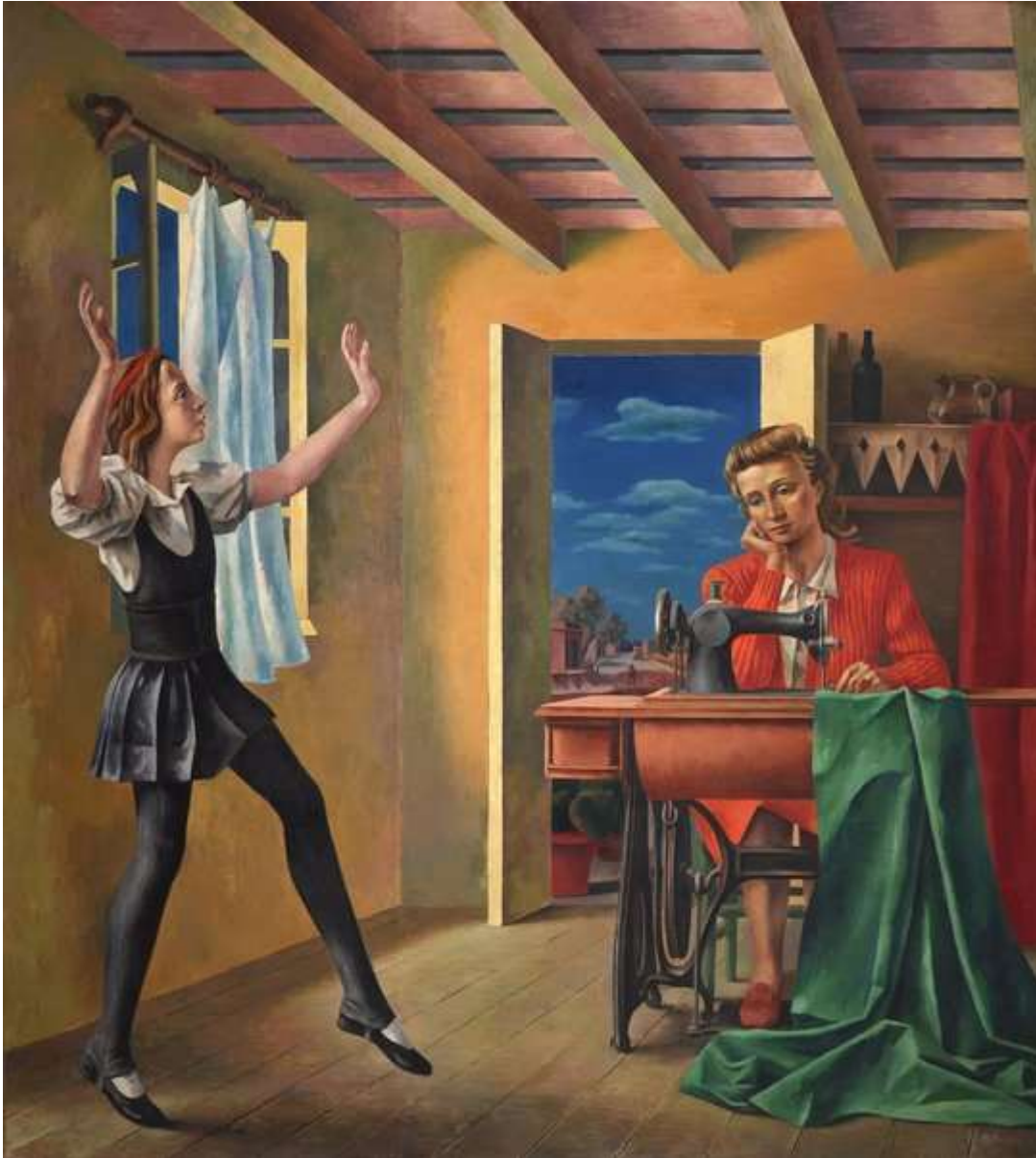
Primeros pasos (1936). Museo Nacional de Bellas Artes (MNBA)