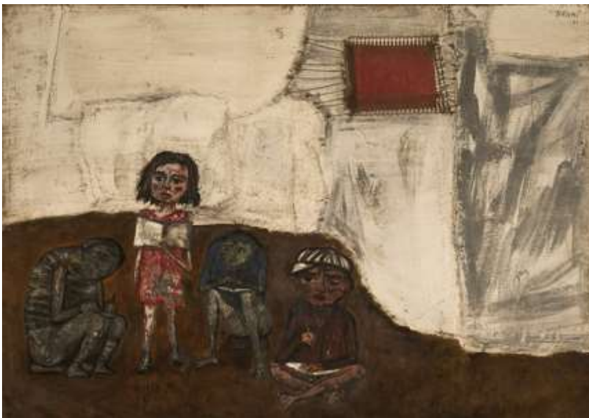
Juanito Laguna aprende a leer (1961). Museo Nacional de Bellas Artes (MNBA)

"Juanito Laguna surge en el Gran Buenos Aires, cuando comencé a hacer una serie de apuntes en los barrios pobres y al ver ese conjunto de chicos y sentí que todavía yo no lo había personalizado lo suficiente", contó Berni una vez. Y agregó: "Pero si bien es un arquetipo del Gran Buenos Aires podría ser un arquetipo de todos los chicos de la ciudad de Latinoamérica: es un chico pobre, pero no un pobre chico; no es un vencido por las circunstancias, sino un ser lleno de vida y de esperanzas y que supera su miseria circunstancial porque intuye vivir en un mundo cargado de porvenir".